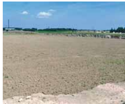
Det øverste jord og lerlag fjeres og efter afgravningen påfyldes med muld, og marken kan igen anvendes til sit oprindelige formål.

På det danske marked udgør savsmuldmurstenen mere end halvdelen af alle mursten, der anvendes i indermuren eller i skillerum inde i boligen.